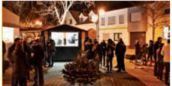
Stand Dez. 2017, Änderungen vorbehalten.

Musik- und Kulturverein +43 (0) 676 / 83 33 45